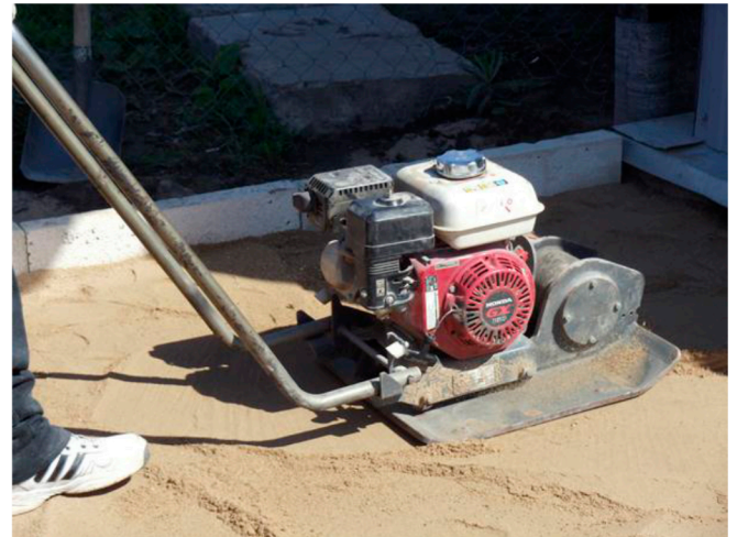
засыпка песчано-гравийного слоя и установка бордюрного камня

Для монтажа подстилающего слоя с дренажными свойствами используется раствор специальной сухой смеси БЕТОПОР .